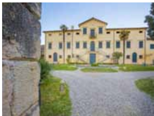
Villa La Sorte a San Peretto

Villa La Sorte si trova nella frazione di San Peretto. La villa, risalente al XVIII secolo, ha semplici linee architettoniche, impreziosite da uno scalone centrale con due rampe simmetriche, ornato da una ringhiera in ferro battuto che si affaccia su un giardino decorato con statue settecentesche di nani che si sviluppa attorno ad una fontana posta al centro.