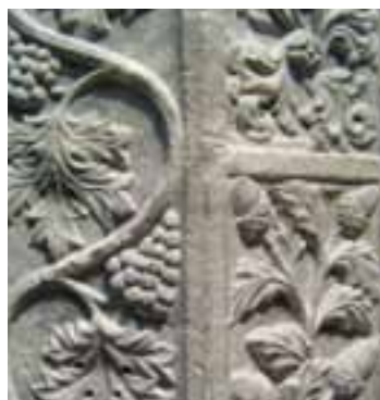
Pietra lavorata: particolare del portale della Pieve di San Pietro Apostolo