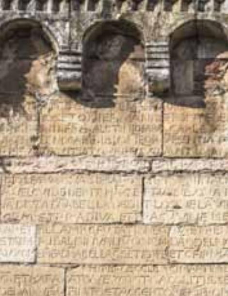
Pieve di San Martino

Le prime notizie della Pieve di San Martino , nel centro del paese di Negrar, risalgono al 1067. La chiesa fu ricostruita nel 1809 e, dell'antica struttura, rimane solo il campanile romanico in tufo e calcare rosso. L'odierno edificio conserva al suo interno un antico organo e alcune tele del '600 e del '700. Sul lato meridionale della torre campanaria è conservata un'iscrizione del 1166, la Carta Lapidaria , composta da sessantaquattro righe incise in caratteri maiuscoli, che riporta una serie di contratti mediante i quali la Pieve di Negrar riscattava un vecchio censo annuale dovuto al cittadino veronese Ribaldino, costituendo un vero e proprio contratto notarile.