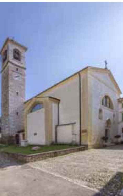
Pieve di San Pietro Apostolo

La Pieve di San Pietro Apostolo si trova nella frazione di Arbizzano e, come riportava un'iscrizione dipinta un tempo all'interno della facciata, potrebbe risalire al 417 d.C., anche se si ha una documentazione certa solo a partire dal 1056.