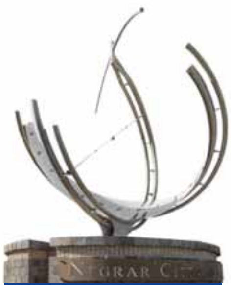
Meridiana di Negrar

Valpolicella è anche storia, cultura, paesaggi naturalistici, tradizioni, enogastronomia.