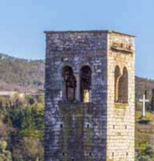
Chiesa di San Peretto

L'originale Chiesa di San Pietro , conosciuta come "San Piereto" per distinguerla dal più importante San Pietro In Cariano, è documentata a partire dal 1222. Conserva all'interno pregevoli decorazioni, un affresco gotico del XV secolo ed una pala "Madonna con Bambino che dà la corona a Sant'Eugenio".