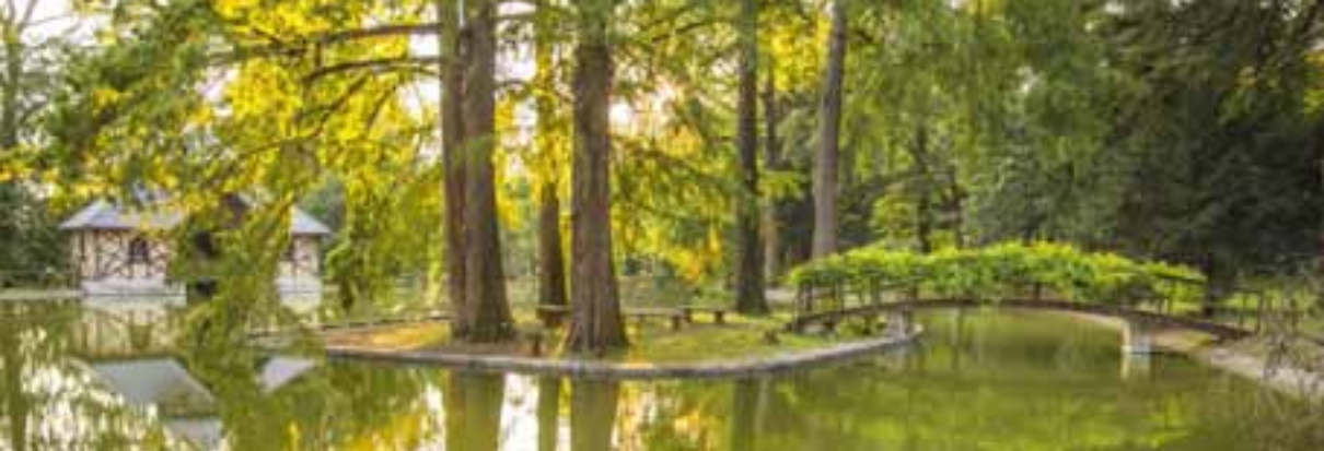
Parco di Villa Bertani a Novare

Villa Mosconi Bertani , situata in località Novare, fu edificata in tufo tenero della Valpolicella nella prima metà del '700 dall'architetto Adriano Cristofori, su incarico di Giacomo Fattori, ed ultimata dai conti Mosconi i quali ne acquisirono, successivamente, la proprietà. La Villa si sviluppa in un corpo centrale e due ali laterali che racchiudono il giardino.