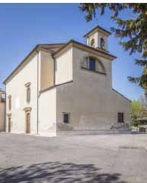
Chiesa di Santa Maria in Progno

La Chiesa di Santa Maria in Progno è un antico Santuario della Madonna del Carmine del XVIII secolo, costruito su una cappella attestata già nel 1222 e dipendente dalla Pieve di Negrar.