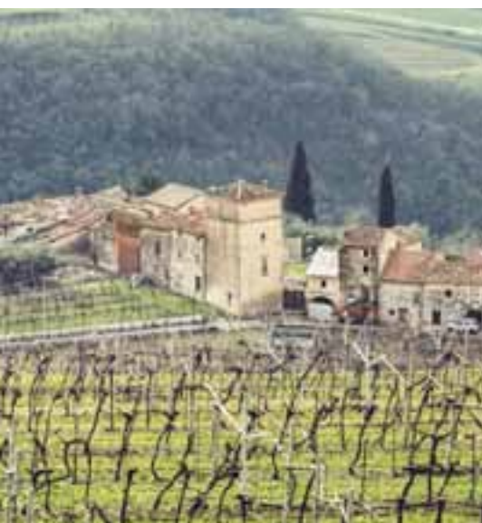
Villa Quintarelli a Noval di Torbe

Villa Quintarelli , in località Noval, nella frazione di Torbe, risale al XV secolo ed è considerata uno dei primi esempi di villa a portico e loggia a fitta archeggiatura. L'edificio è costituito dal portico terreno a tre fornici, dietro il quale due locali a volta completano la struttura.