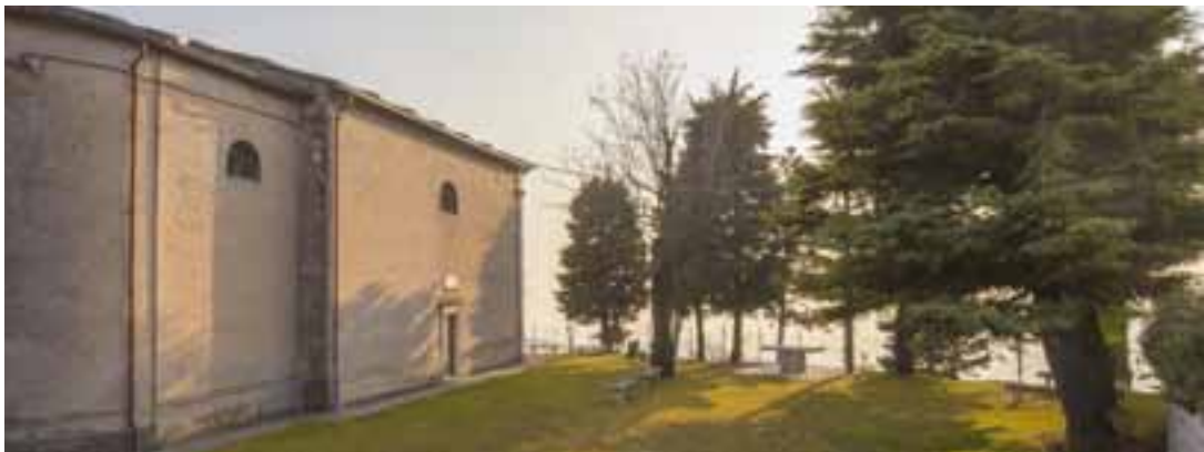
Chiesa delle Salette

La Chiesa della Salette si trova nella frazione di Fane. Non si hanno notizie certe circa la data della sua costruzione. Grazie alla tradizione orale sappiamo però che negli anni '60 dell'Ottocento erano presenti nella comunità due frati missionari molto devoti alla Madonna della Salette e che nel 1868 i francesi costruirono un santuario a lei dedicato. Col passare degli anni, la Chiesetta venne abbandonata e restaurata più volte. All'interno del cancello, che delimita il giardino antistante, vi è una statua in marmo di Carrara della Madonna della Salette, donata nel 2001 dallo scultore Rinaldo Dalle Pezze.