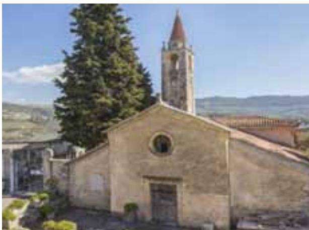
Chiesa di San Pietro a Torbe

La Chiesa di Torbe risale alla seconda metà del XII secolo ed era una cappella dipendente dalla Pieve di San Martino di Negrar. Di tutti gli edifici romanici della Valpolicella è quella che conserva sostanzialmente intatto il complesso civico-religioso medioevale, formato da chiesa, sacrestia, campanile, cimitero, casa canonica e sede comunale.