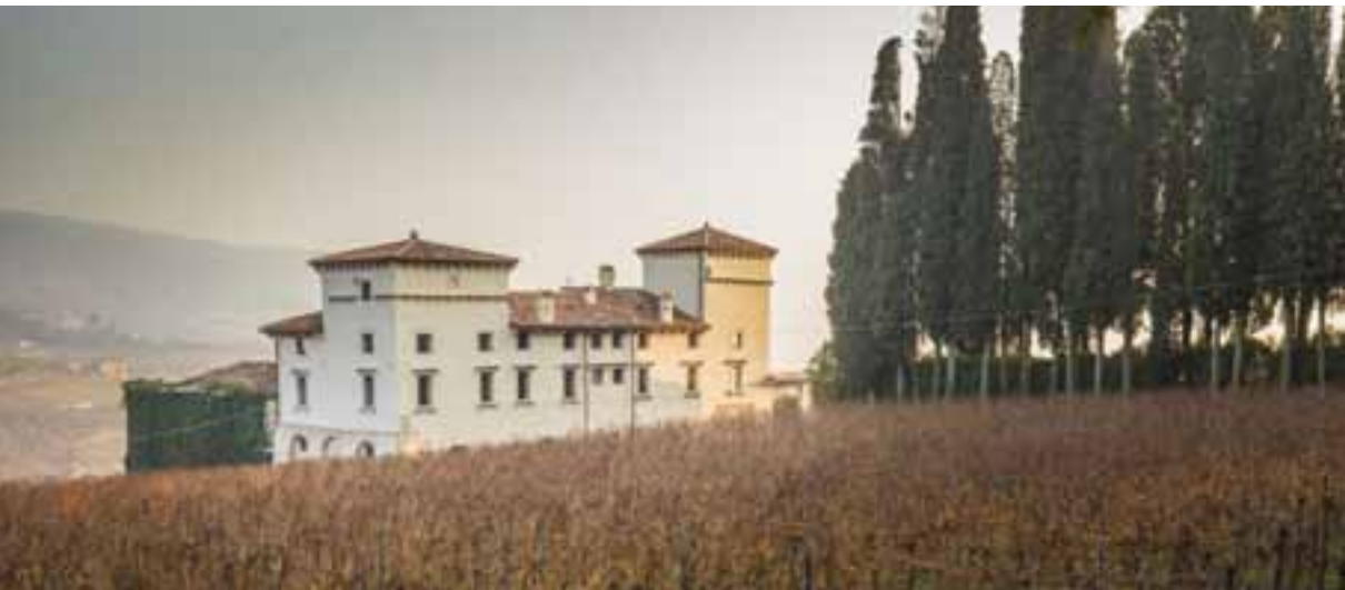
Villa Salvaterra a Prun

La loggia superiore presenta otto archi accoppiati a bifore, incassate in specchi marcati e separati da una lesena di muro. Il cortile è lastricato e conferisce all'insieme una base di elegante rusticità. Il rivestimento esterno in pietra di Prun arriva al primo piano e sul retro della villa si ergono due torri colombaie.