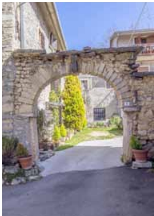
Portale d'ingresso di un cortile in loc. Saline

Nel territorio comunale sono numerosi anche i capitelli e le croci, costruiti sempre in pietra locale. Tra i tanti, ricordiamo il Capitello di San Rocco a Villa , con un portale di accesso ad una corte che presenta sulla sinistra una pittura murale dell'Annunciazione e sulla destra, in una nicchia, una statuetta di San Rocco; e la Croce della Masua , una croce singolare, posta su un muro di recinzione, con braccia a tre punte arrotondate, datata 1886.