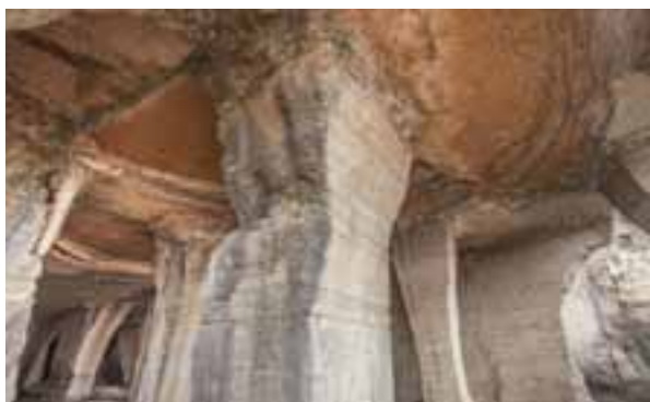
Cave di Prun