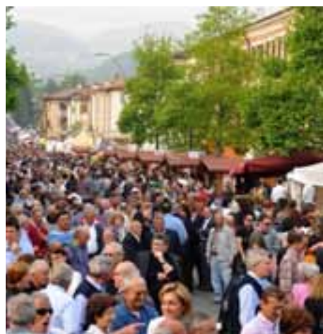
Palio del Recioto e dell'Amarone a Negrar

Il martedì dopo Pasqua si tiene il Gran Premio Palio del Recioto , evento sportivo internazionale, al quale partecipano ciclisti professionisti provenienti da tutta Italia e dall'estero.