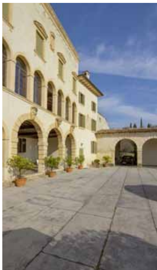
Villa Turco-Zamboni ad Arbizzano

Nel 1776 vi nacque e operò lo scienziato Giuseppe Zamboni.