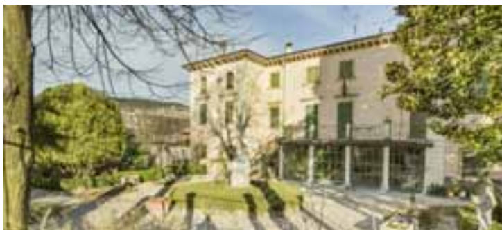
Villa Quintarelli di Villa

La tenuta di Pojega fu acquistata nel 1649 dai conti Rizzardi, già residenti a Verona. Villa Rizzardi è stata ristrutturata intorno al 1850, con richiami al Quattrocento veneziano, su progetto dell'architetto Filippo Messedaglia (1823-1901). Il Giardino di Pojega , a Pojega, fu realizzato tra il 1783 e il 1791, commissionato dal conte Antonio Rizzardi all'architetto Luigi Trezza. Trezza concepì una sintesi tra giardino all'italiana e giardino romantico, con composizioni di architettura "in verde" come il boschetto con il Tempio circolare, il Ninfeo, il Giardino segreto, il Laghetto ovale, il Parterre, il Teatro di verzura, con palcoscenico, orchestra e cavea semicircolare, e il Belvedere. Una serie di statue di soggetto mitologico, poste a completamento e decorazione del giardino, anima i diversi percorsi, definendo un ricco e complesso programma iconografico. Disposto su tre livelli, si estende per una superficie di 54.000mq.