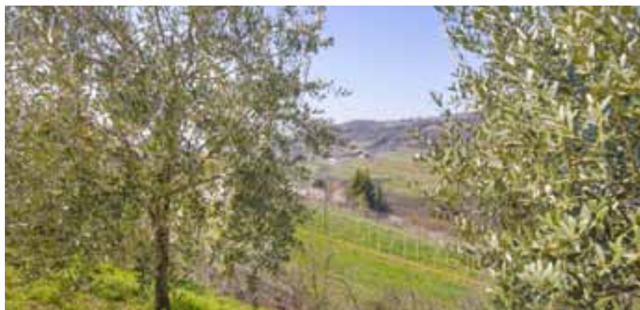
Coltivazione di Olivi

Così come per la vite, anche la coltivazione dell'olivo risale all'epoca romana. Per quanto riguarda la valle di Negrar, l'olivo è presente soprattutto sulle colline, nella parte meridionale e le varietà principali sono Grignano, Favarol e Trep e l'olio prodotto ha un colore verde-oro e un profumo delicato.