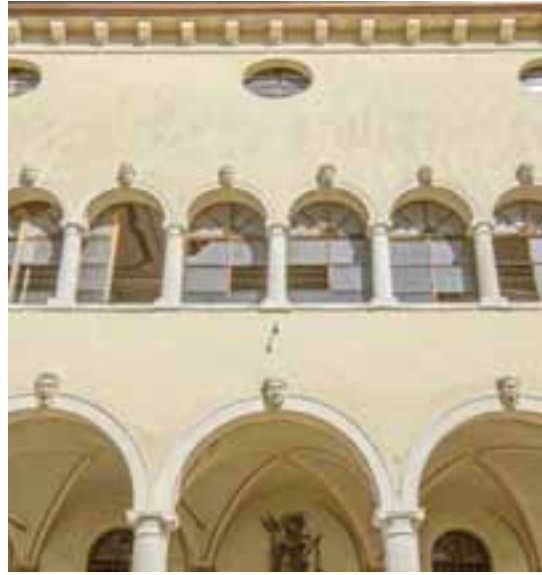
Villa Bertoldi a Negrar

Villa Salvaterra , nella frazione di Prun, potrebbe essere stata costruita in due tempi, tra la fine del Cinquecento e l'inizio del secolo successivo. È la villa ubicata a maggior altezza sul livello del mare (520 m) tra le ville della bassa e media Valpolicella.