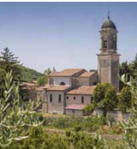
Chiesa della Maternità della Beata Vergine

La Chiesa della Maternità della Beata Vergine , nella frazione di Montecchio, si presenta nelle forme attuali verso la metà del XVIII sec. ed è riconosciuta come oratorio pubblico a partire dal 1790. Ha una facciata a capanna in stile neoclassico e torre campanaria addossata al fianco settentrionale del presbiterio. Il portale d'ingresso è di forma rettangolare, preceduto da una scalinata e inquadrato da due coppie di lesene, ed è sovrastato da un medaglione di forma circolare all'interno del quale è inserito un bassorilievo raffigurante una "Vergine con Bambino e S. Giovannino".