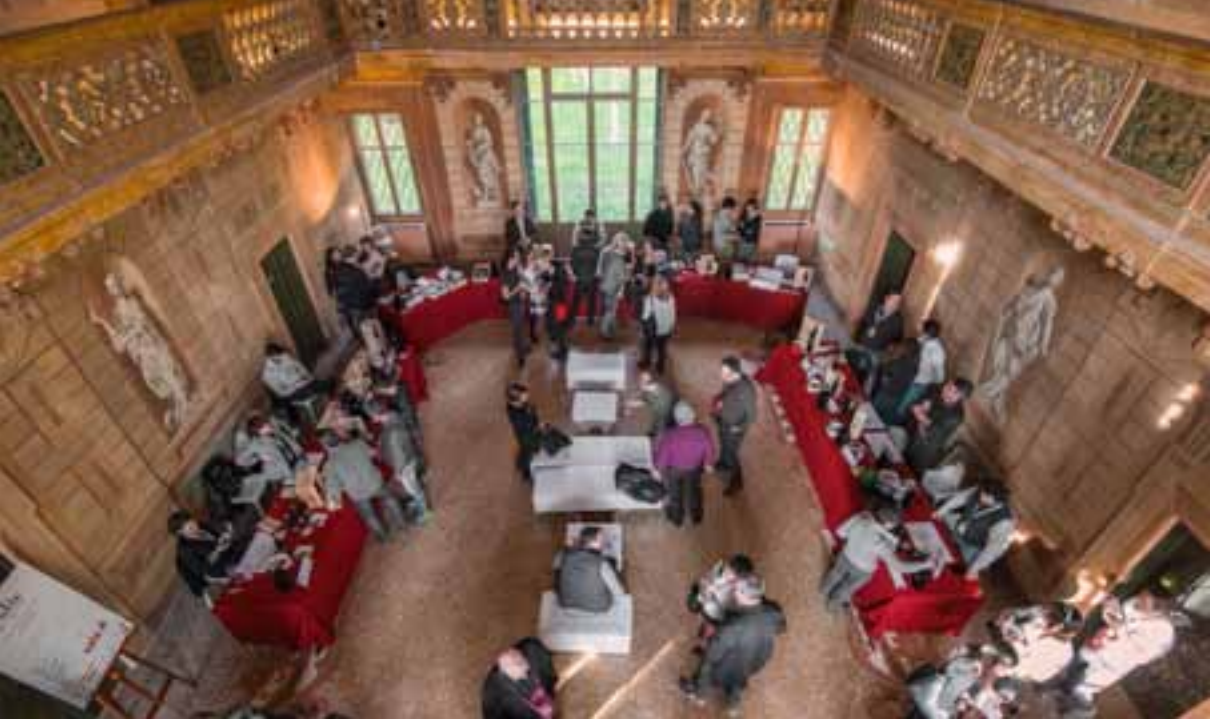
Vetrina dell'Amarone 2016, Villa Mosconi Bertani

Il Palio del Recioto nasce nel 1953 per far conoscere i vini della Valpolicella Classica e il loro territorio grazie alla lungimiranza dell'allora sindaco Guido Ghedini. Il Palio è l'appuntamento più sentito dagli abitanti di Negrar e di richiamo per i visitatori: le cantine si sfidano in una competizione che premia il miglior Recioto prodotto con le uve raccolte nell'ultima vendemmia e che si può degustare solo in occasione di questo evento. La tradizione vuole che il vincitore sia proclamato il lunedì di Pasqua. Durante la manifestazione è possibile degustare i Reciotti del Palio e gli altri vini della Valpolicella nei chioschi lungo le vie del paese.